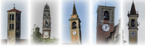
CASTELVIVO DEL ZAPPA - CASTELVIVO - COSTA SANT'ABAMO - MARZALENGO - SAN MARTINO IN BELSETO